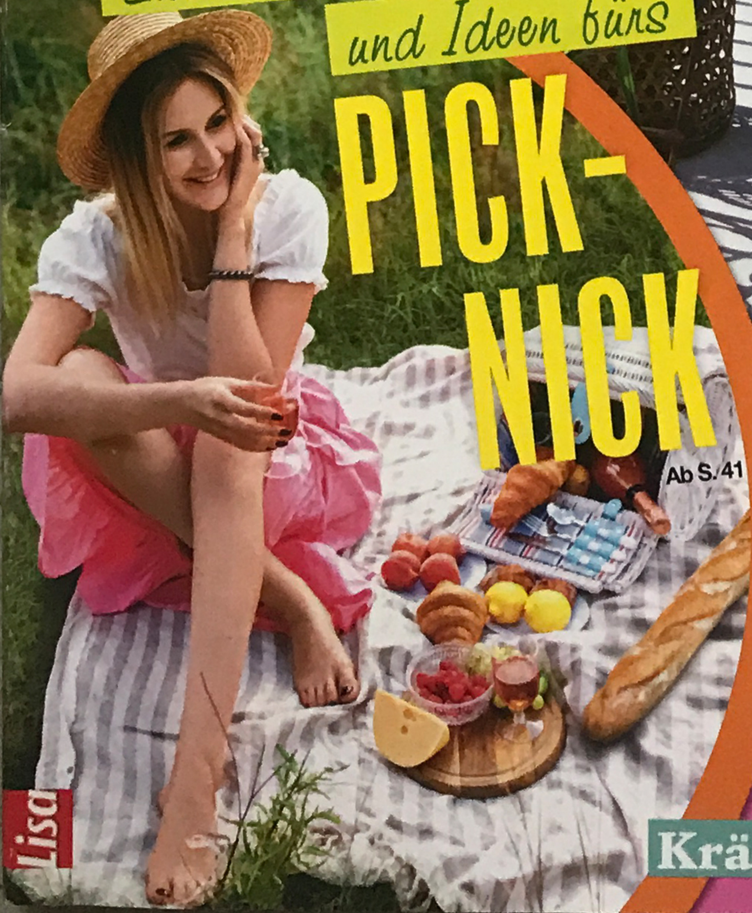
Ab S. 41