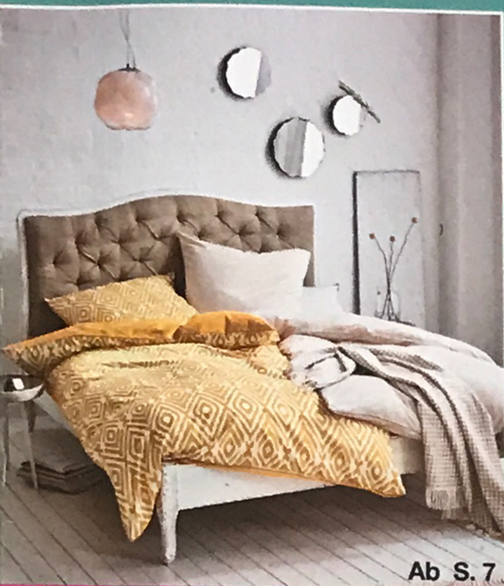
Ab S. 7

Nr. 5/2020 Deutschland 2,90 € | Österreich 3,20 € Schweiz 5,10 SFR | Benelux 3,30 € | Frankreich 3,30 € Italien 3,30 € | Slowenien 3,30 € | Slowakei 3,70 € | Spanien 3,30 €