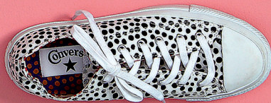
Chucks mit Marimekko-Print, ca. 100 Euro, www.converse.de